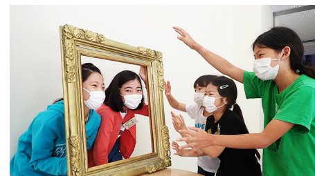
注意事項を写真で伝えます!