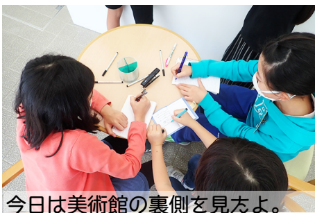
今日は美術館の裏側を見よう。

8月27日に北海道の緊急事態宣言が始まって、今日もまだ美術博物館は休館中です。でも、びとこまは子ども記者もびとこまを読んでいる人もみんながとっても楽しみにしているので活動できることになりました。今日は毎年作っていてもまだまだたくさんさんの収蔵作品があるので、10月9日から始まる展覧会「鳥のいる風景」に出展される作品をもとにコレクションカードを作ります!