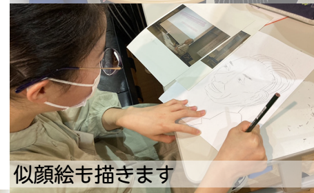
似顔絵も描きます