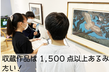
収蔵作品は1,500点以上あるみたい!